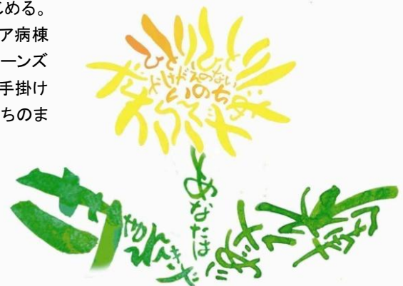
エフ・フィールド ロゴアート

佐賀大学大学院在学中から、ピアノ弾き語り、作曲活動をはじめ。佐賀、福岡を中心に演奏活動を行い、好生館病院での緩和ケア病棟のボランティア活動が NHK 佐賀放送局で取り上げられる。ティーンズミュージカル SAGA に楽曲提供、指導。CMソング、映像音楽も手掛けている。2007年 絵本「つながってる!」、2009年 絵本「いのちのまつり」、2010年 絵本「おかげさま」のテーマ曲を作曲。 ホームページ: http://yugemusic.com